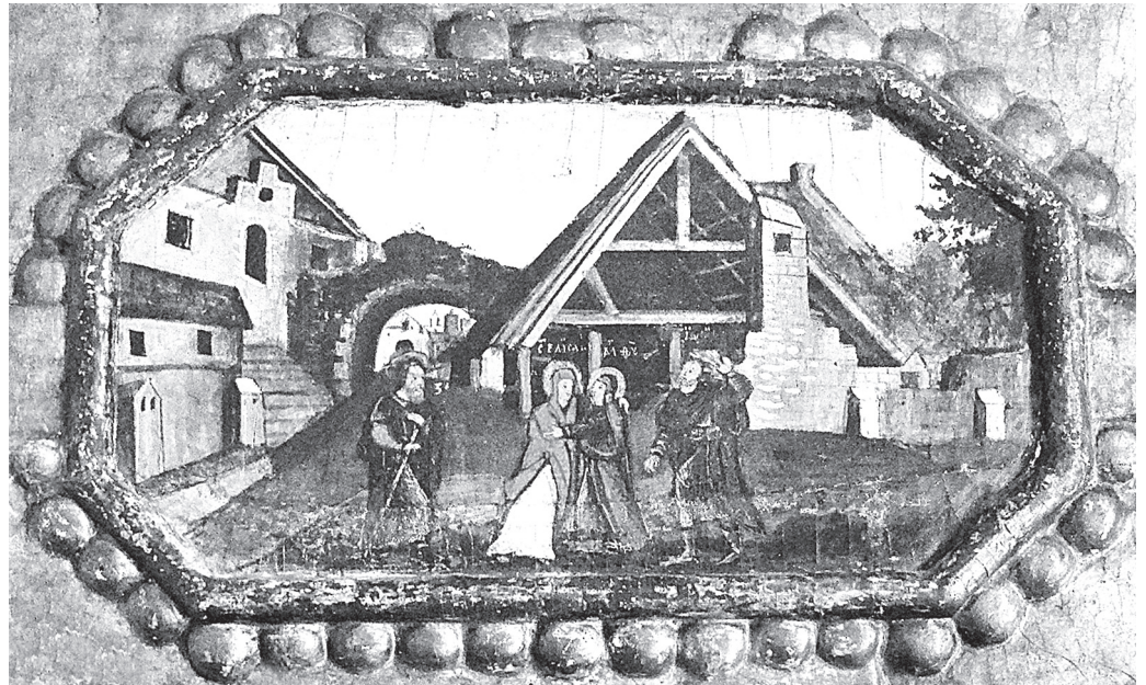
Найстаріше зображення Дрогобицької солеварні на фрагменті ікони з церкви Воздвиження Чесного Хреста в Дрогобичі.

На Поліссі київському й волинському та місцями в Галичині були рудні, копальні залізної руди. Залізо добували там мабуть уже в княжих часах,