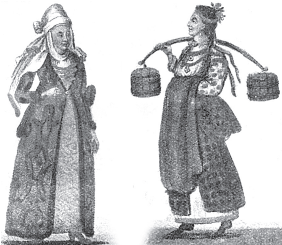
Українська пані у святочній ноші XVII ст. (ліворуч) та українська дівчина з XVII ст.

Часопис «Життя і знання». Львів. Лютий 1933 р. Ч. 2(65), С. 38.