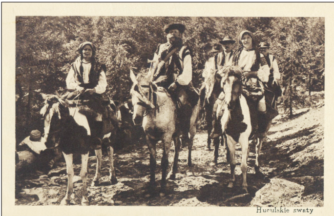
Гуцульські свати. Надвірна, 1929 р.

гілочку, вбирають невеликими китицями із калини, вівса, барвінку, чорнобривців і др. квіток та хлібових рослин, перевивають їх кольоровими нитками, шовком чи биндами; до гілячок приліплюють невеличкі засвічені воскові свічечки. Поміж гілячок гильця кладуть трохи жита, іноді гильце буває так прибрано, що й листя не видно – самі квітки. Гильце завжди ставиться на протилежному від покуття кінці стола, де стоїть воно увесь час. Почесне місце у весільному обряді займає коровай та його зготування. З короваем зв'язується достаток, багатство молодих: «скільки пар робило коровай, щоб стільки пар молодий мав волів».