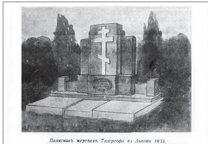
Пам'ятник жертвам Талергофа во Львові 1933.

Талергоф залишив настільки помітний слід у нашій історії, що йому присвячено багато пам'яток: поштівок, значків, а також пам'ятників, які збереглися до нашого часу. Такими, зокрема, є пам'ятник у Львові на Личаківському цвинтарі, а також у с. Лішня Дрогобицького району та с. Гнила Турківського району. Вони – мовчазні свідчення болю, перенесеного галичанами під час Першої світової війни.