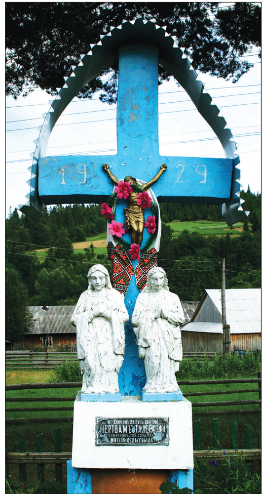
Пам'ятник жертвам Талергофа, споруджений у 1929 р. у с. Гнила Турківського району.

На одному з подвір'їв села споруджено пам'ятник жертвам Талергофа. Це композиція Розп'яття з престоячими св. Іваном і св. Марією висотою приблизно 3,5 метра. Оригінальне Розп'яття не збереглося і з часом замінене на металеве. На хресті вказаний рік спорудження – 1929. Знизу прикріплена металева таблиця із написом: «Мученикамъ за Русь Святую. Жертвамъ Талергофа. Пам'ятникъ той создали жители села Гныла».