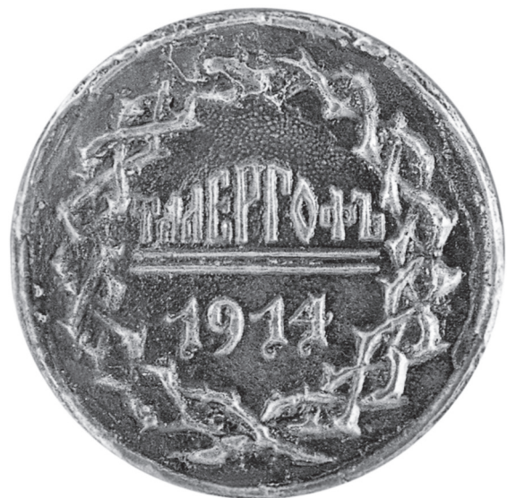
Відзнака пам'яті ув'язнення у Талергофі, 1920 – 1930-ті рр. Ø 28 мм.

Як бачимо, поляки не стояли осторонь, а з метою вбити клин між українцями, підтримували