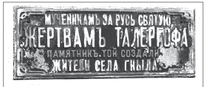
Металева таблиця, прикріплена до пам'ятника.