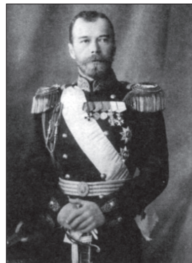
Цар Микола II (1868 - 1918), останній з династії Романових.

У великому, старому московському соборі горіло кілька тисяч свічок, в їх дрижачому блиску мерехтіли золотом та каменями висаджувані бані та творили для багатотисячної юрби небуденне видовище. На тому тлі мінився дорогий