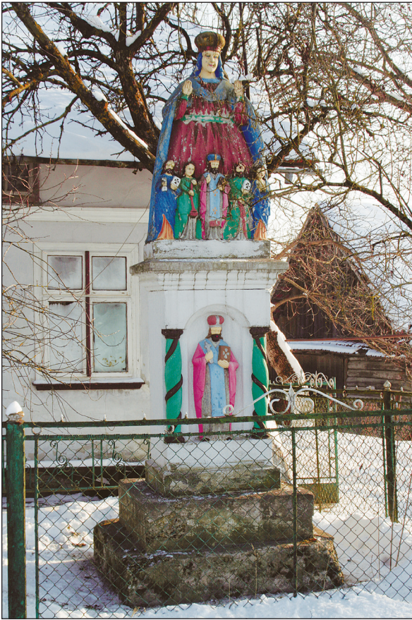
Пам'ятник у селі Лішня Дрогобицького району. Споруджений у 1928 р. з нагоди щасливого повернення з Талергофа.