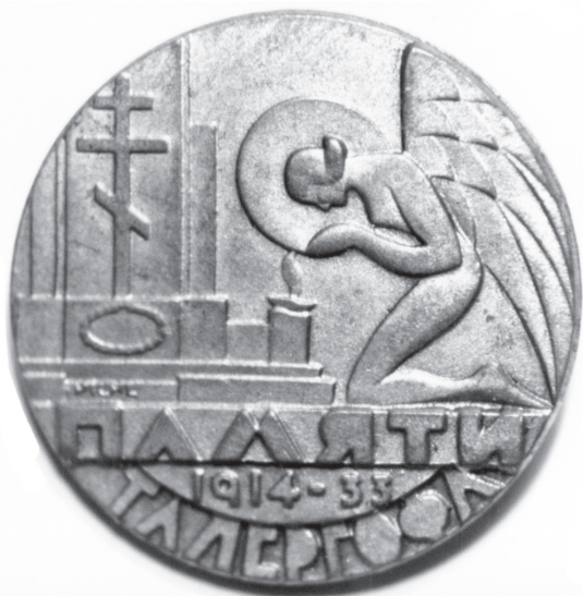
Пам'ятна відзнака з нагоди відкриття пам'ятника жертвам Талергофа у Львові, 1933 р. Ø 26 мм.

москвофілів. Зрештою, безпідставно доносили й самі українці, бо теж зводили рахунки зі своїми співвітчизниками, і не тільки політичні. Саме цими факторами можна пояснити те, що чимало невинних галичан потрапляли до цього табору. Доноси набули масового характеру.