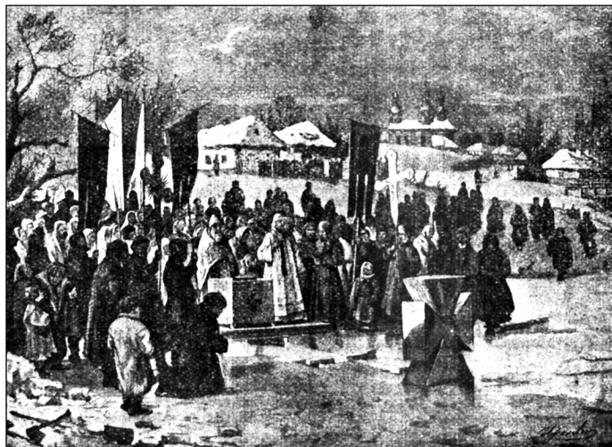
Йордан на Наддніпрянщині (малюнок І. Іжакевича)

Гуцули роблять досвіта воскові хрестики, кидають їх у воду й миються у тій воді. Потім приліплюють їх у хаті по одному на середині кожної стіни, п'ятий ліплять на сволюку, відтак по одному наліплюють кожній худобині на правий ріг, та ще на всіх дверях, які худоба переступає.