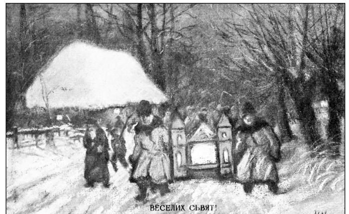
Веселих Свят! Вертеп. Поштова листівка 1938 р.

дещо меншою та й одяг вже не такий колоритний. Однак тішить те, що він все ж зберігся, адже у роки радянського воєвничого атеїзму релігія зазнала значних переслідувань. Це свідчить про невмирущість наших традицій та звичаїв.