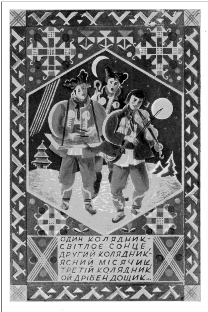
Веселих Свят! Серія "Українські колядки". Худ. С. Гординський. В-во "Союзний Базар". Львів, 1930-ті рр.

кира. По вечері діти під столом квокають, а старші кидають їм горіхи.