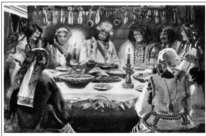
Христос Родився! Худ. О. Курилас. В-во «Українська Преса» у Львові, 1920-ті рр.

що на ньому із трьох сторін роблять пальцями три шрами, а насередині дірку, в дірку сиплють мак та кладуть головку часнику.