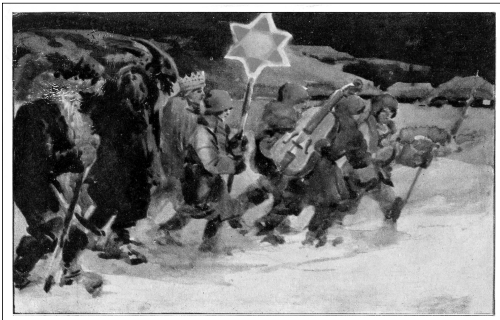
Христос Родився! Вертеп. Худ. О. Курилас. В-во "Українська преса" у Львові, 1939 р.